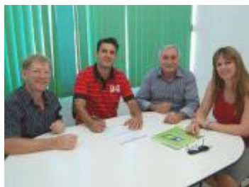
Sicoob Credial é parceiro do Liquida Maravilha 2012.

A promoção Liquida Maravilha 2012, promovida pelo Núcleo de Desenvolvimento Comercial da Associação Empresarial de Maravilha, conta mais uma vez com o patrocínio oficial do Sicoob Credial.