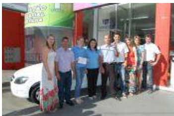
Ganhadores recebem prêmios da Campanha Natal Maravilha 2011

A entrega foi realizada nesta quinta (5).